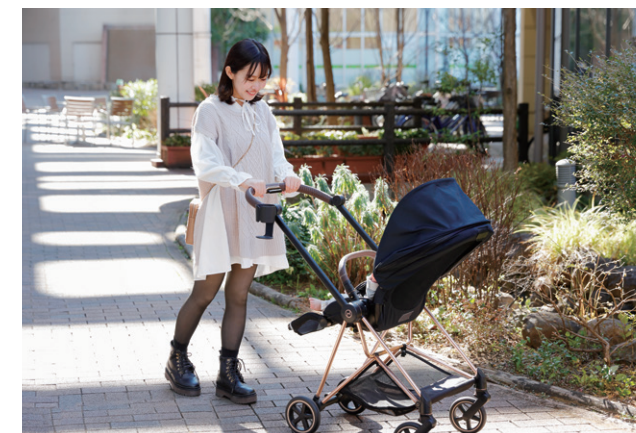
これからの季節、赤ちゃんとのお出かけが楽しみに！