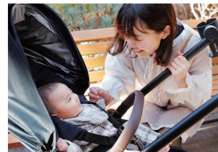
ベビーカーでのお出かけはママも赤ちゃんも気分転換になりますね。

お出かけには欠かせないベビーカー選び、ライフスタイルに合わせたものを選ぶことが大切です。ベビークッズを熟知した店舗スタッフに気軽に相談してみましょう。