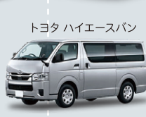
トヨタ ハイエースバン