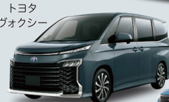
トヨタ ヴォクシー