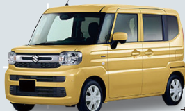
スズキ スペーシア