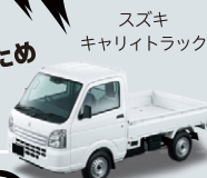
スズキ キャリイトラック